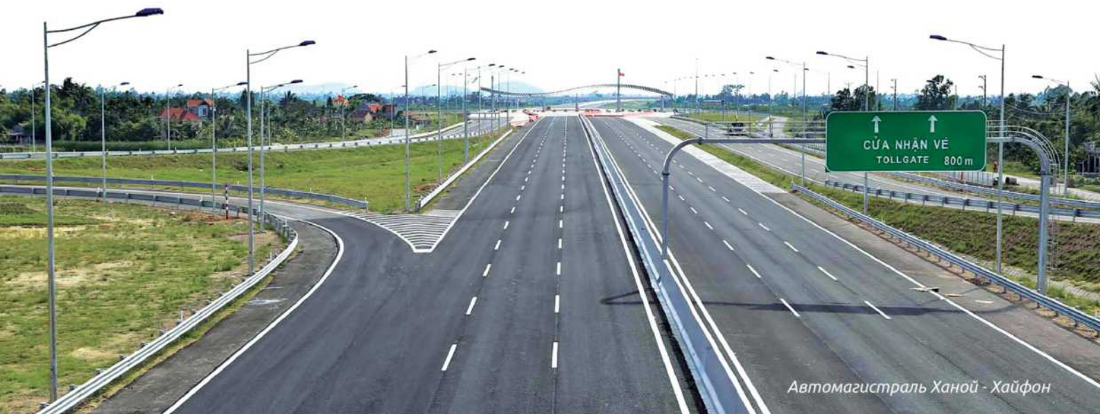
Автоматрираль Ханой - Хайфон

› Главные порты: » Кай Лан Порт 30,000 DWT